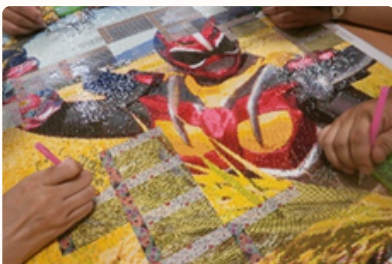
ダイヤモンドアート